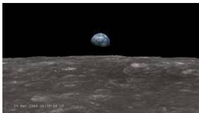
Lever de Terre de l'orbite lunaire (1968)